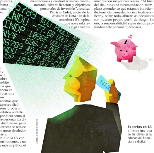
Expertos en IA afirman que una de las claves es la educación financiera y digital.