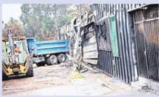
IMAGEN DE LA CIUDAD

Un desnivel bastante riesgoso para quienes transitan por el lugar es el que hay en la vereda de calle Independencia al llegar a Pedro de Oña, en Concepción.