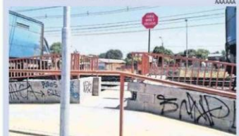
IMAGEN DE LA CIUDAD

Cerca de la esquina de las calles Barros Arana con Rengo hay un agujero en la vereda a causa de la ausencia de algunos adoquines. Esta situación pone en peligro de caída a las personas que pasan por ahí.