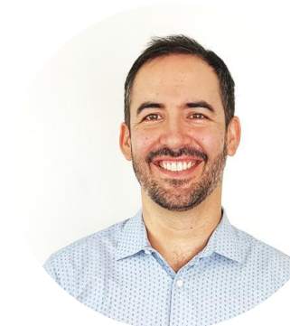
Centro Nacional en Sistemas de Información en Salud CENS Dr. Mair Caro