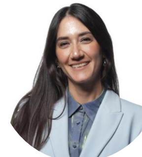
Medtronic Argentina Ing. Biomédica Azul Quiroga