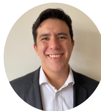
Universidad Pontificia Católica - ETESA Acad. Felipe Vera C.