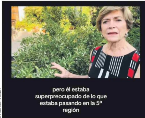
CAPTURA DE PANTALLA