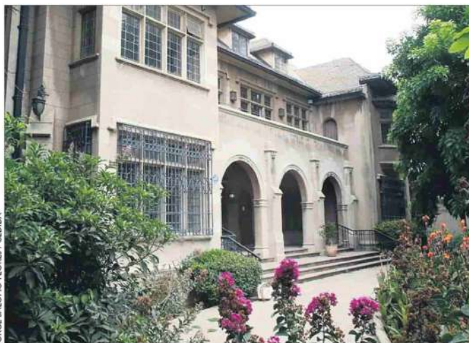
JORGE SALOMO FLORES / CEDIDA