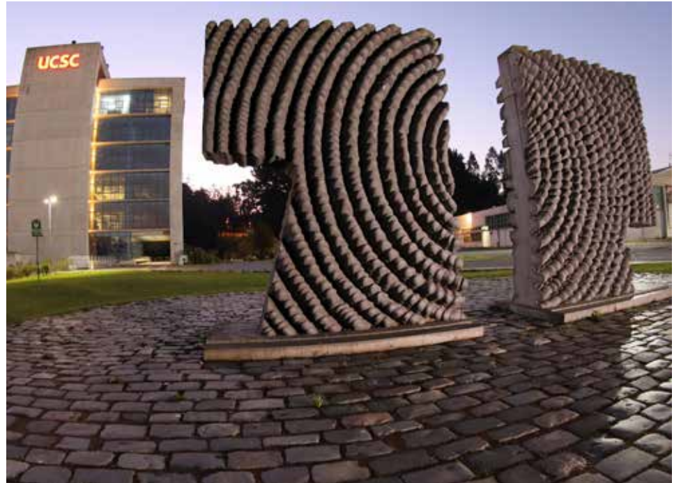
La escultura de Federico Assler resguarda el Edificio Central del Campus. Fue confeccionada en hormigón gris oscuro y la conforman dos piezas de 3 metros de alto y 2,40 de ancho.