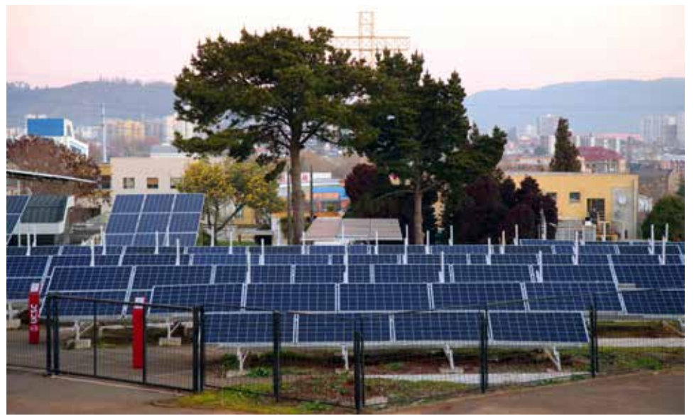
La MicroRed considera una superficie de 790 m 2 en el patio de paneles fotovoltaicos y generadores eólicos, junto con de un laboratorio de 45m 2 , todo con una potencia instalada de 44kW, equivalente a escala semi industrial.