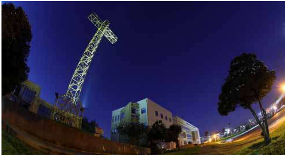
La cruz que se erige en el corazón de la UCSC se situó a los pies del altar de la homilía que celebró Juan Pablo II en su visita a Chile en 1987.