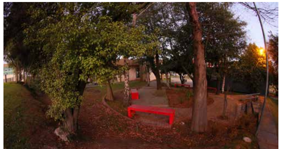
La Plaza Inclusiva y de Recreación es parte de una iniciativa estudiantil que cuenta con accesos para personas con movilidad reducida.