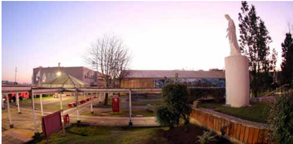
La Universidad ha potenciado su labor en las áreas de docencia, investigación, vinculación y gestión.

Abierto a la comunidad, este Campus universitario no solo alberga facultades y laboratorios, sino también ofrece un panorama familiar que al recorrerlo, mezcla la naturaleza, el deporte y el arte al aire libre.