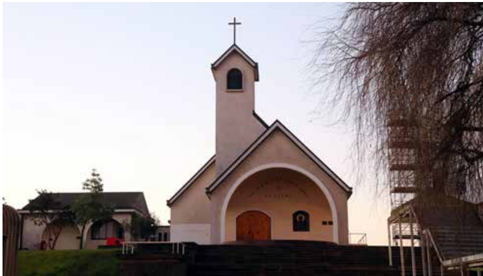
La Capilla Santa María Reina acoge las eucaristías con distintos vecinos que congregan a la Comunidad Universitaria.